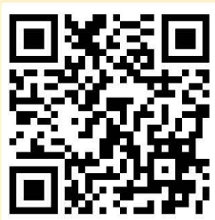
西鬧二手市場部落格

詳情請洽 | 臺北市電影主題公園 02-2312-3717#19; www.cinemapark.org.tw